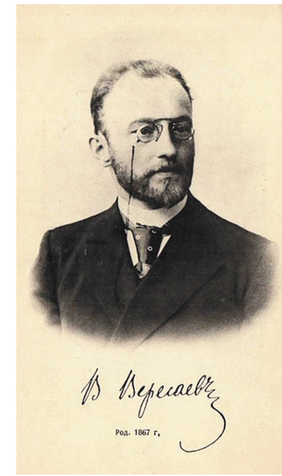
Викентий Викентьевич Вересаев

выработавшего определённые ответы на все сложные вопросы врачебной науки, этики и профессии; это также не записки врача-философа, глубоко проникшего в суть науки и вполне владевшего ею». «Записки врача» рассказывали о практике молодого врача, его столкновении с не романтичной реальностью, об экспериментах на людях и врачебной этике. Всё описанное в произведении является актуальным и для современного студента медицинского института. Поэтому обращение к данной книге В. В. Вересаева поможет студенту-медику приспособиться к условиям врачебной науки, гармонично вписаться или войти в её русло, почувствовать себя настоящим будущим врачом, стать частью этой необъятной, сложной, но чрезвычайно интересной, с одной стороны, науки, а с другой — искусства, имя которому — медицина.